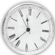
( Wilhelm Busch)

Scheint dir auch mal das Leben rau, sei still und zage nicht, die Zeit, die alte Bügelfrau, macht alles wieder schlicht.