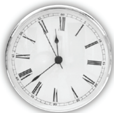
( Wilhelm Busch)

Scheint dir auch mal das Leben rau, sei still und zage nicht, die Zeit, die alte Bügelfrau, macht alles wieder schlicht.