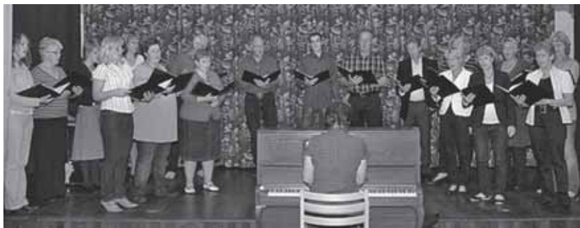
Unsere schwedischen Gäste: Hultsfred kyrkokören

Wir freuen uns sehr, dass unser nun schon vierjähriger Kontakt zu Kirchenmusikern und Chören in Schweden sich in diesem Jahr noch weiter intensiviert. In der Himmelfahrtswoche bekommen wir Besuch vom Kirchenchor der schwedischen Kirchengemeinde Hultsfred. Gemeinsam wollen wir ein Konzert mit Werken Mozarts und Vivaldis und natürlich echten schwedischen Sommerliedern gestalten.