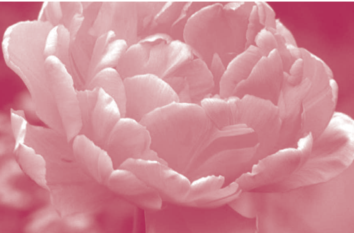
Die Gemeine Pfingstrose ( Paeonia officinalis ), auch Benediktinerrose, Echte Pfingstrose, Bauern-Pfingstrose, Garten-Pfingstrose, Knopfrosee, Kirchenrose, Kirchenblume, Buerrose, Pumpelrose, Gichtrose, Ballerose, Antonirose (die rosa Paeonie blüht meist um den 13. Juni, dem Tag des Hl. Antonius von Padua) und Pfaffarose genannt, gehört zur Gattung der Pfingstrosen ( Paeonia ).

DIE DREI EV.-LUTH. KIRCHENGEMEINDEN IN HAMBURG-LOHBRÜGGE Auferstehungs-Kirchengemeinde · Erlöser-Kirchengemeinde · Gnaden-Kirchengemeinde