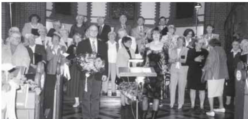
Chöre Erlöserkirche und Gnadenkirche

hat, einer Schule für heimatlose und verwaiste Mädchen in Venedig, an der Vivaldi unterrichtete.